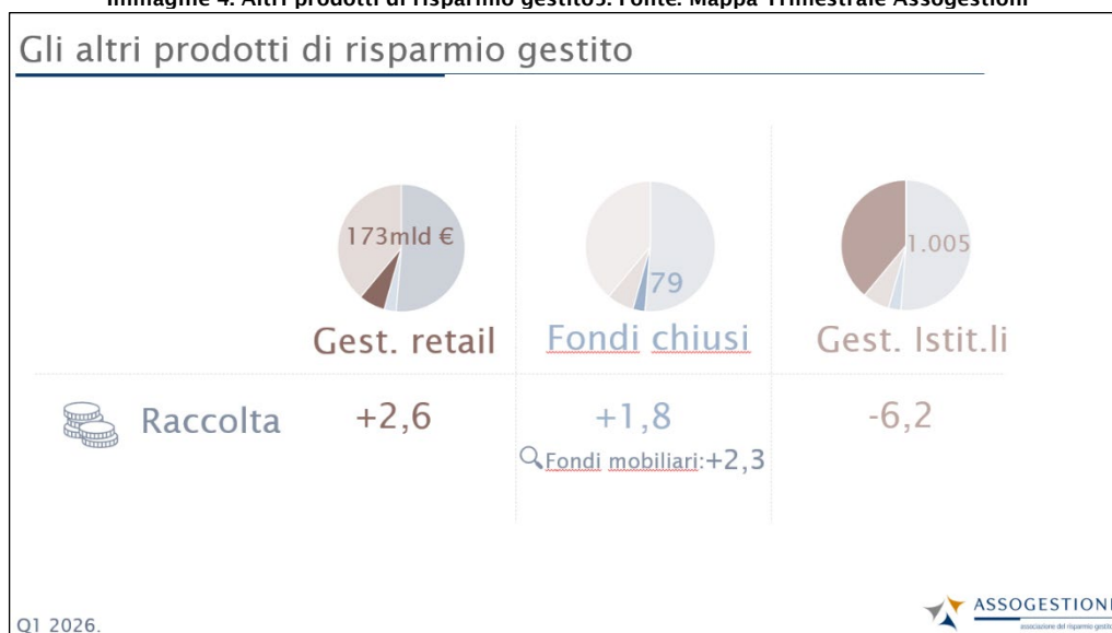
Immagine 4. Altri prodotti di risparmio gestito5.

Infine, il segmento dei mandati istituzionali ha chiuso il primo trimestre con una raccolta negativa per 6,2 mld euro.